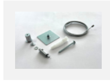
145-50300, N Seile 2000mm + Metallhalter;