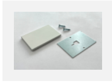
145-50102, W 2 x Metall-Endkappe ohne Schrauben