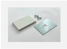
145-50102, W 2 x Metall-Endkappe ohne Schrauben