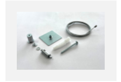
145-50301, N Seile 4000mm + Metallhalter;