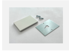
145-50102, B 2 x Metall-Endkappe ohne Schrauben