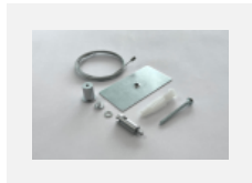
145-50303, N Seile an Profilverbindung 2000mm - 1 Stk. + Metallhalter