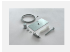
145-50305, N Seile an Profilverbindung 6000mm - 1 Stk. + Metallhalter