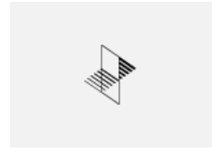
145-01200, F Zubehör für Demontage El. Modules für Lina145