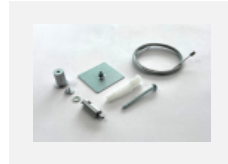
145-50300, N Seile 2000mm + Metallhalter;