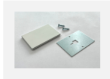
145-50102, B 2 x Metall-Endkappe ohne Schrauben