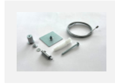
145-50300, N Seile 2000mm + Metallhalter;