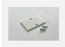
145-50101, B 2 x Metall-Endkappe mit Schrauben