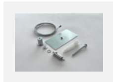
145-50304, N Seile an Profilverbindung 4000mm - 1 Stk. + Metallhalter