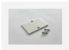
145-50101, S 2 x Metall-Endkappe mit Schrauben