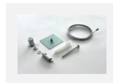
145-50302, N Seile 6000mm + Metallhalter;