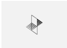
145-20700, S Wandhalter (2 Stk) Lina45