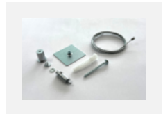
145-50302, N Seile 6000mm + Metallhalter;