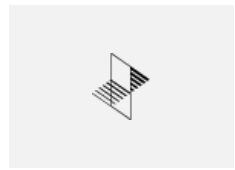
145-01200, F Zubehör für Demontage El. Modules für Lina145