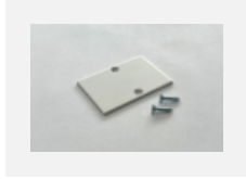
145-50101, S 2 x Metall-Endkappe mit Schrauben