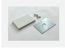
145-50102, S 2 x Metall-Endkappe ohne Schrauben