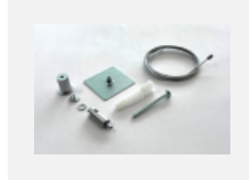
145-50301, N Seile 4000mm + Metallhalter;