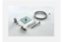
145-50302, N Seile 6000mm + Metallhalter;