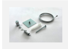
145-50301, N Seile 4000mm + Metallhalter;