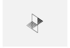
145-01200, F Zubehör für Demontage El. Modules für Lina145