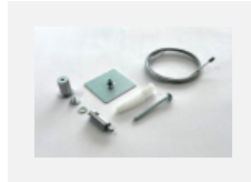
145-50301, N Seile 4000mm + Metallhalter;