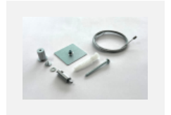
145-50302, N Seile 6000mm + Metallhalter;