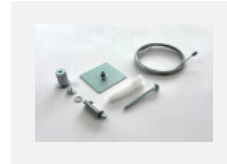
145-50301, N Seile 4000mm + Metallhalter;