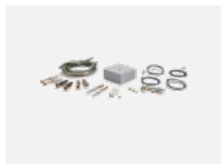
00-00333, W Seilaufhängungsset- 4 Seile 2000mm, Kabel 5x0,75mm, Baldachin