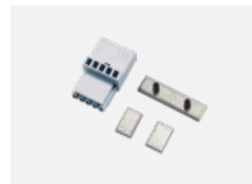
132-50200, F Direkter Verbinder