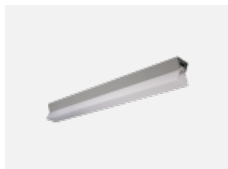
132-50031, W Pendeltubus 1000 mm