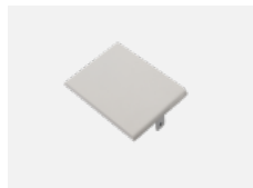
132-50100, W Endkappe