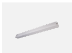
132-51100, K Diffusor 2295 mm