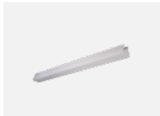
132-51100, K Diffusor 2295 mm