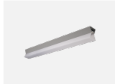
132-50031, W Pendeltubus 1000 mm