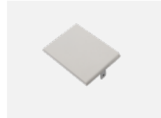
132-50100, W Endkappe