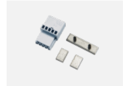
132-50200, F Direkter Verbinder