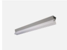
132-50031, S Pendeltubus 1000 mm