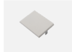
132-50100, S Endkappe