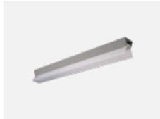
132-50031, B Pendeltubus 1000 mm