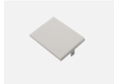
132-50100, B Endkappe