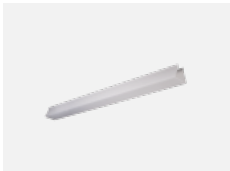
132-51100, K Diffusor 2295 mm