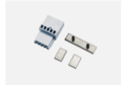
132-50200, F Direkter Verbinder