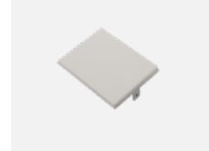
132-50100, B Endkappe