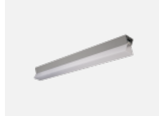
132-50031, W Pendeltubus 1000 mm