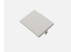
132-50100, W Endkappe