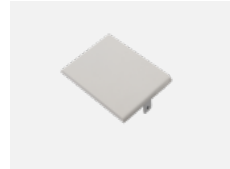
132-50100, S Endkappe