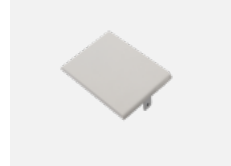
132-50100, S Endkappe