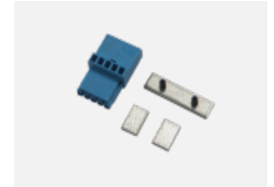
132-50201, F Direkter Verbinder