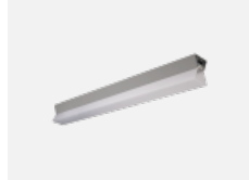
132-50031, S Pendeltubus 1000 mm