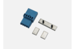
132-50201, F Direkter Verbinder