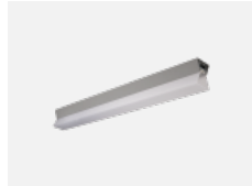
132-50031, S Pendeltubus 1000 mm