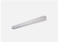
132-51100, K Diffusor 2295 mm