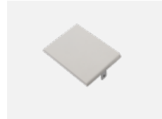
132-50100, B Endkappe