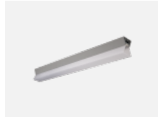
132-50031, B Pendeltubus 1000 mm