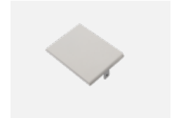
132-50100, W Endkappe