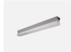
132-50031, W Pendeltubus 1000 mm