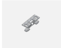
00-00600, F Deckenhalter für Leuchten 132-5xxK, 04-2000x, 05-2000x, 09-200x – 1 Stck.