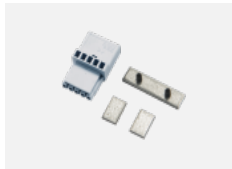
132-50200, F Direkter Verbinder