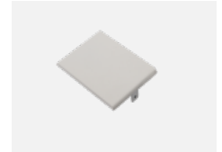
132-50100, W Endkappe