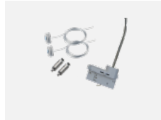
00-51300, W Set für Aufhängung in 3Ph-Schiene für nicht dimmbare Leuchten