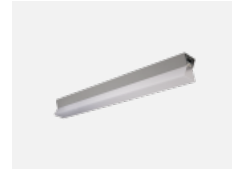
132-50031, W Pendeltubus 1000 mm