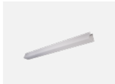
132-51100, K Diffusor 2295 mm