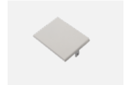
132-50100, B Endkappe