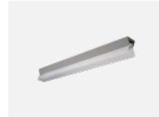
132-50031, B Pendeltubus 1000 mm