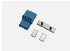
132-50201, F Direkter Verbinder