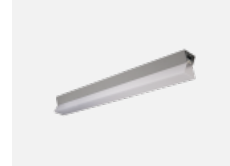
132-50031, S Pendeltubus 1000 mm