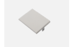
132-50100, S Endkappe