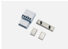
132-50200, F Direkter Verbinder