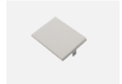
132-50100, B Endkappe