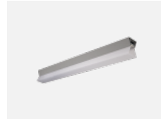
132-50031, B Pendeltubus 1000 mm