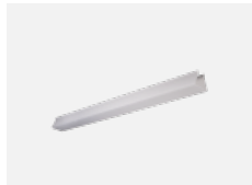
132-51100, K Diffusor 2295 mm