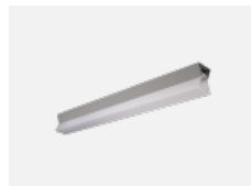
132-50031, B Pendeltubus 1000 mm