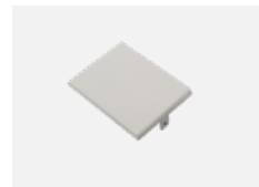
132-50100, B Endkappe