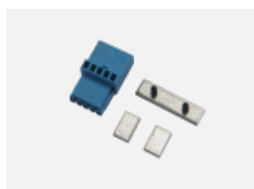
132-50201, F Direkter Verbinder