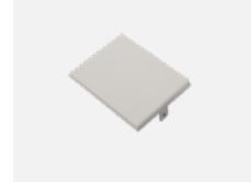
132-50100, S Endkappe