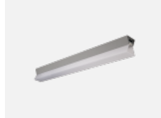
132-50031, S Pendeltubus 1000 mm