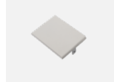
132-50100, S Endkappe