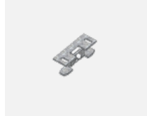
00-00600, F Deckenhalter für Leuchten 132-5xxK, 04-2000x, 05-2000x, 09-200x – 1 Stck.