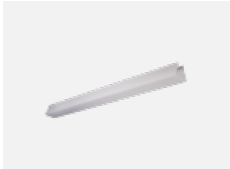
132-51100, K Diffusor 2295 mm