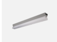
132-50031, B Pendeltubus 1000 mm