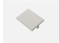
132-50100, B Endkappe