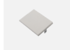
132-50100, B Endkappe