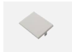
132-50100, S Endkappe