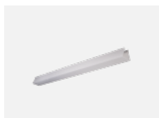
132-51100, K Diffusor 2295 mm