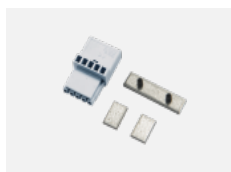
132-50200, F Direkter Verbinder