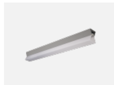
132-50031, S Pendeltubus 1000 mm