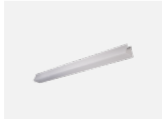
132-51100, K Diffusor 2295 mm