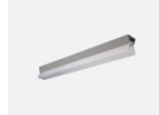
132-50031, S Pendeltubus 1000 mm