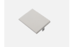
132-50100, S Endkappe