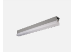
132-50031, S Pendeltubus 1000 mm