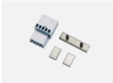
132-50200, F Direkter Verbinder