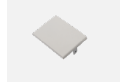
132-50100, B Endkappe