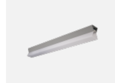
132-50031, B Pendeltubus 1000 mm