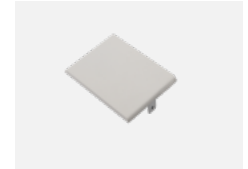
132-50100, S Endkappe