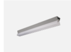
132-50031, S Pendeltubus 1000 mm