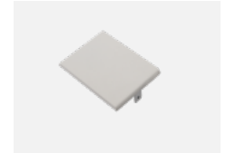
132-50100, S Endkappe