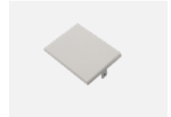
132-50100, S Endkappe