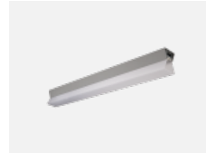
132-50031, S Pendeltubus 1000 mm