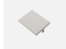
132-50100, W Endkappe