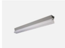
132-50031, W Pendeltubus 1000 mm