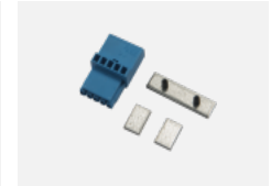
132-50201, F Direkter Verbinder