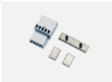
132-50200, F Direkter Verbinder