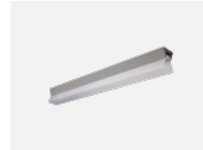
132-50031, B Pendeltubus 1000 mm