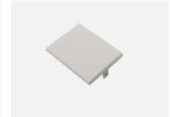
132-50100, B Endkappe