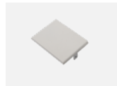
132-50100, W Endkappe