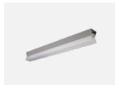
132-50031, W Pendeltubus 1000 mm