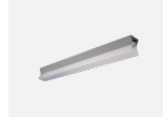
132-50031, W Pendeltubus 1000 mm