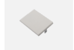
132-50100, W Endkappe