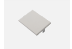
132-50100, S Endkappe