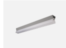
132-50031, S Pendeltubus 1000 mm