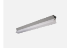
132-50031, B Pendeltubus 1000 mm