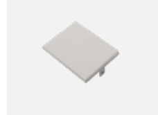
132-50100, W Endkappe