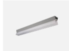
132-50031, B Pendeltubus 1000 mm