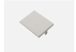
132-50100, B Endkappe