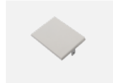
132-50100, W Endkappe