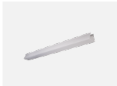
132-51100, K Diffusor 2295 mm