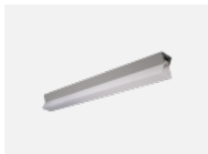
132-50031, B Pendeltubus 1000 mm