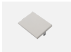
132-50100, B Endkappe