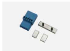
132-50201, F Direkter Verbinder