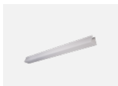
132-51100, K Diffusor 2295 mm