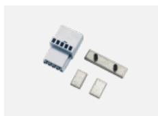
132-50200, F Direkter Verbinder