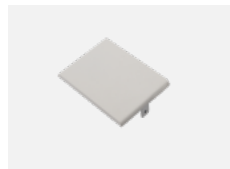
132-50100, W Endkappe