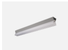
132-50031, W Pendeltubus 1000 mm