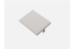
132-50100, W Endkappe