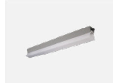
132-50031, W Pendeltubus 1000 mm