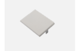
132-50100, B Endkappe