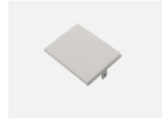
132-50100, W Endkappe