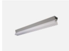
132-50031, B Pendeltubus 1000 mm