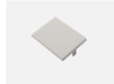
132-50100, B Endkappe